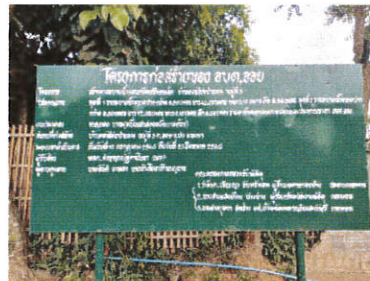
ภายในหมู่บ้าน บ้านดอนไชยป่าแถม หมู่ที่ 3