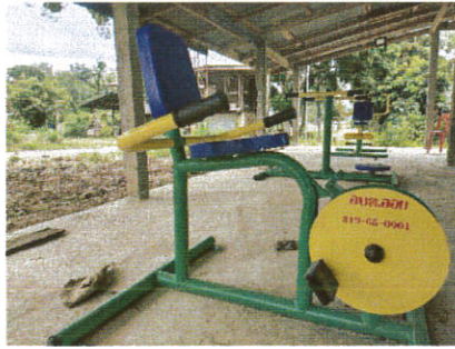
เครื่องออกกำลังกาย