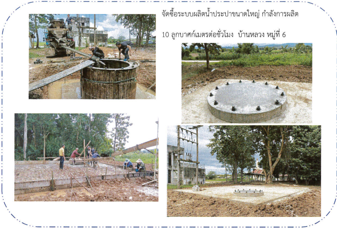
จัดซื้อระบบผลิตน้ำประปาขนาดใหญ่ กำลังการผลิต