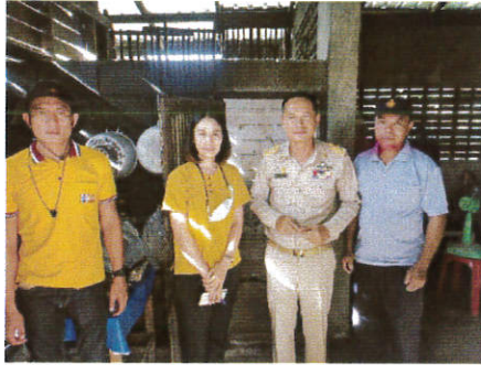
บ้านป่าพะ หมู่ที่ 8