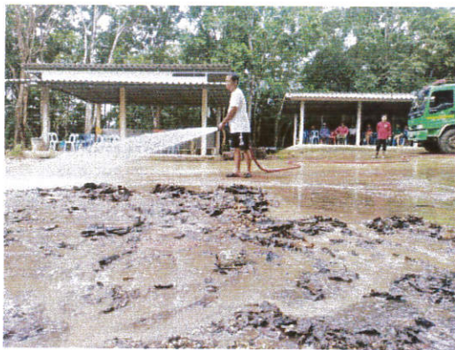
บริการส่งน้ำใช้อุปโภคเขตอนุรักษ์ป่าห้วยแก่น