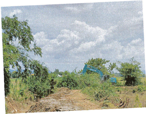
โครงการขุดลอกลำเหมือง บ้านหลวง หมู่ที่ 6