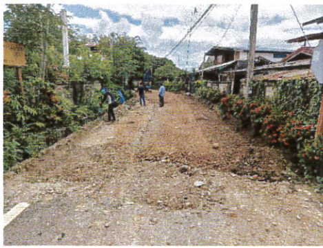
บ้านดอนเจริญ หมู่ที่ 13