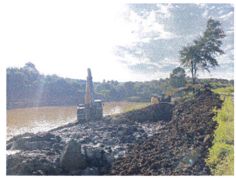
บ้านดอนเงิน หมู่ที่ 1